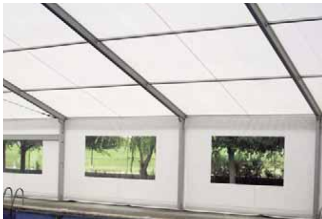
Carpa modelo Big de 20 x 30 metros