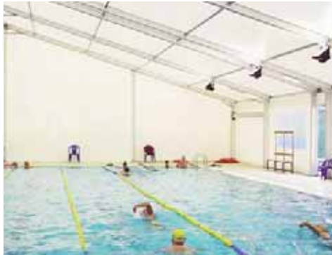
Piscina Municipal de Sant Cugat