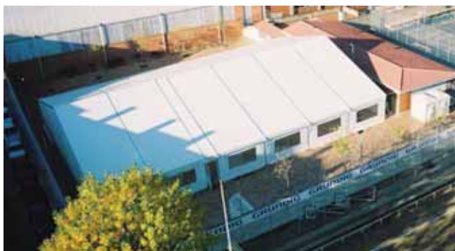
Piscina Municipal Sant Cugat (Barcelona)

En cuanto a la figura en planta es rectangular para todos los modelos.