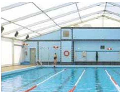
Piscina Municipal de Buñol (Valencia)