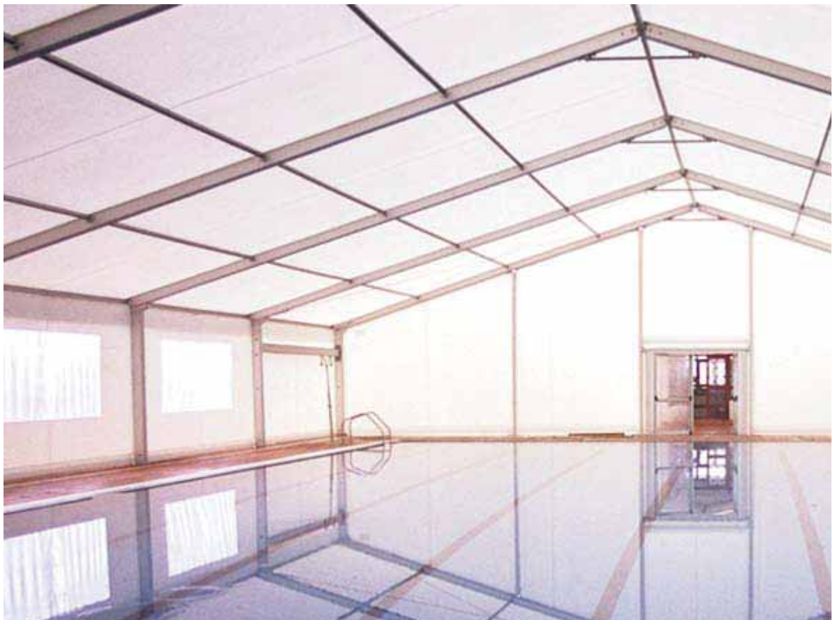
Piscina Municipal de Benifairó de les Valls (Valencia)

Fuente: Peter Neufert, Arte de proyectar en arquitectura Neufert, México, Gustavo Gili, 1995, 14ª ed., P. 466-470