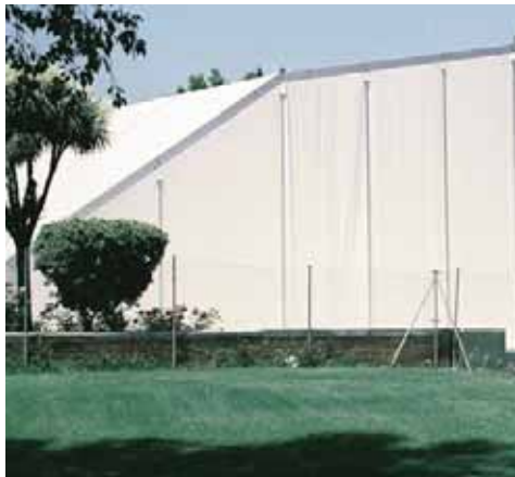
Piscina Municipal de Fuenlabrada (Madrid)