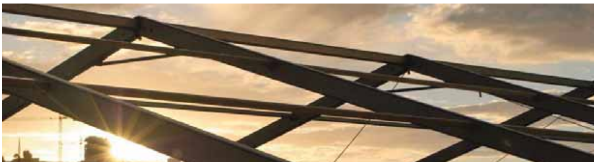
Club de Natación Caballa (Ceuta)