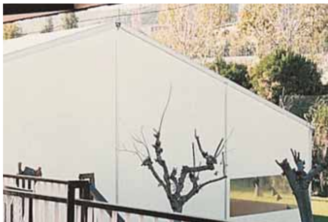
Carpa modelo Big de 20 x 40 metros