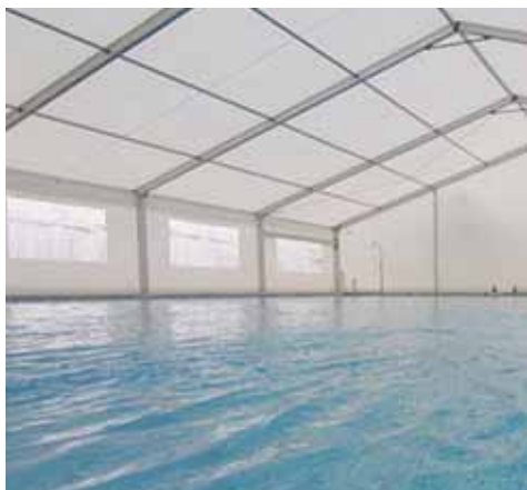
Piscina de Santa Fe de Mondújar (Almería)