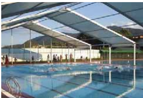
Piscina Municipal de El Tiemblo (Ávila)