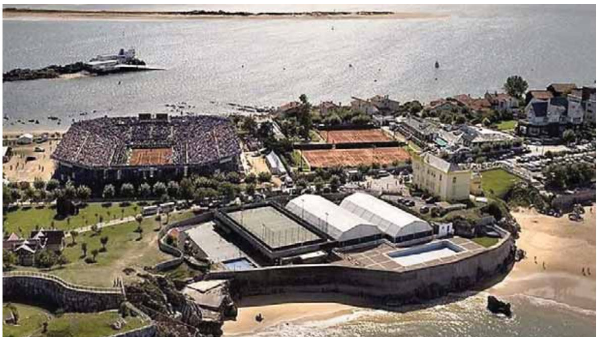
Real Club de Tenis de la Magdalena (Cantabria)