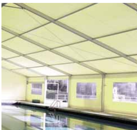
Real Automóvil Club de España (Madrid)