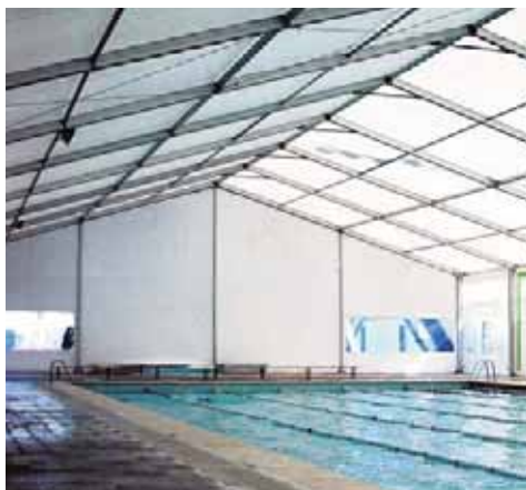
Col·legi Salesià de la Vall d'Hebrón (Barcelona)