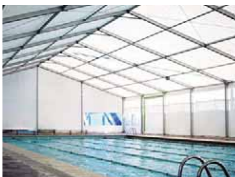
Col·legi Salesià S. Joan Bosco (Barcelona)