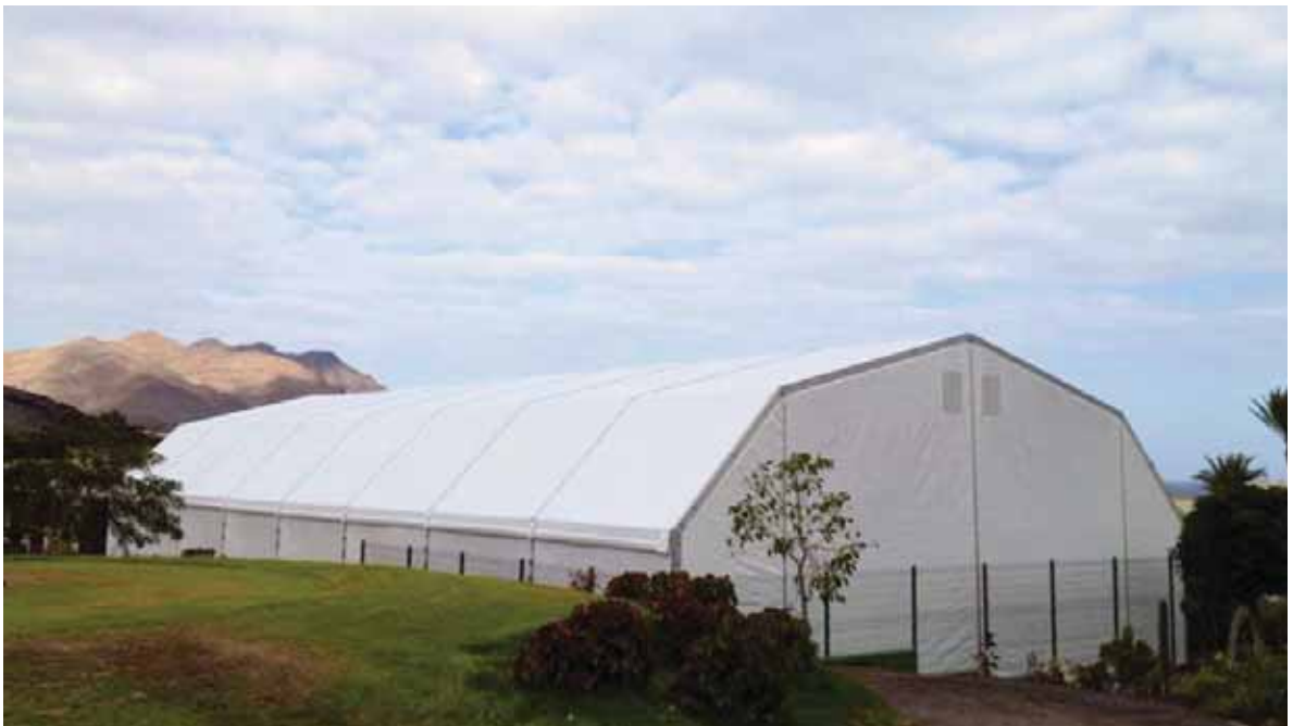
Playitas Resort (Las Palmas)

Nuestra Oficina Técnica está a su disposición para facilitarle aquella información adicional que se requiera para completar el proyecto y su realización