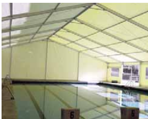
Real Automóvil Club de España (Madrid)