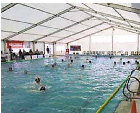
Club de Natación Caballa (Ceuta)