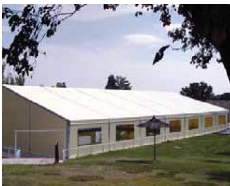
Real Automóvil Club de España (Madrid)