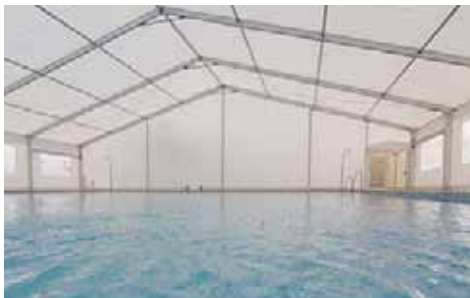
Piscina de Santa Fe de Mondújar (Almería)

Existen buenos equipos de diversos fabricantes que dependen, en cualquier caso, del eficaz mantenimiento posterior. Nuestra Oficina Técnica está a su disposición para ampliarle cuantos datos e información pueda requerir para completar el Proyecto concreto con su instalador.