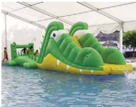
Piscina Municipal de Santa Fe de Mondújar