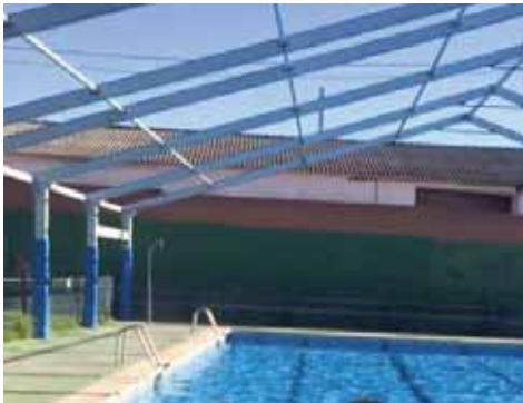
Piscina Municipal de Gálvez (Toledo)

El compuesto textil opaco es de color blanco. Para los compuestos traslúcidos, pueden aplicarse, además del blanco, una gama de colores.