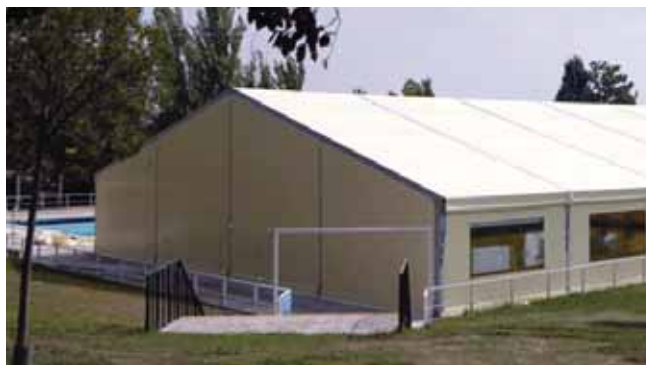
Real Automóvil Club de España (Madrid)