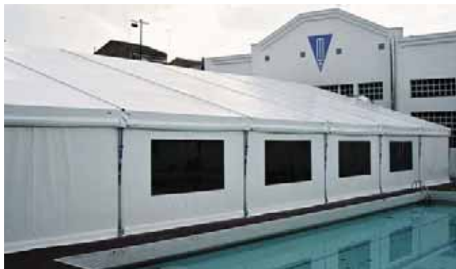
Carpa modelo Big de 18 x 30 metros