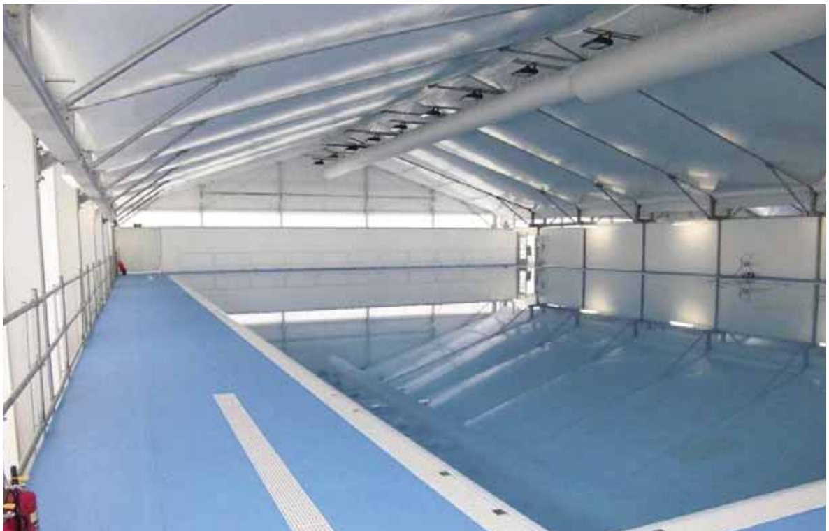
Entrenamientos JJ00 Londres 2012

Este conocimiento y capacidad están a su servicio para ayudarle en su Proyecto.