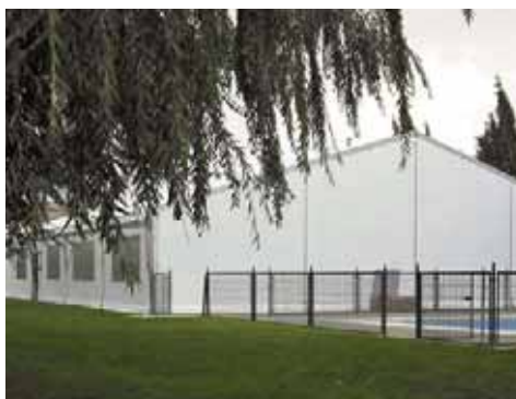
Piscina Municipal de Gálvez (Toledo)

Como complemento específico para piscinas, cabe destacar el pasillo de unión entre la cubierta de piscina y vestuarios. Este se realiza, con una forma y longitud en función del emplazamiento y distancia a cubrir, y con un ancho de 1,5/2 m.