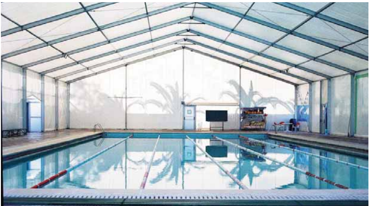
Col·legi Salesià S. Joan Bosco (Barcelona)

El plazo de entrega y montaje, desde el acto de contratación en firme y una vez realizada la definición particular de la cubierta, es de, aproximadamente, 45 días.