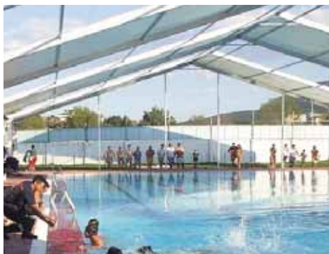
Piscina Municipal de El Tiemblo (Ávila)