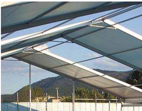
Piscina Municipal de El Tiemblo (Ávila)

En aluminio, acero inoxidable, aluminio fundido, acero fundido y acero galvanizado. Tratamientos anticorrosión por humedad y por la acción del cloro.