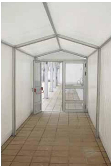
Piscina de Santa Fe de Mondújar (Almería)

En el diseño de la armadura y de las lonas, se han reducido o eliminado los puntos de fuga de aire en uniones y suelo.