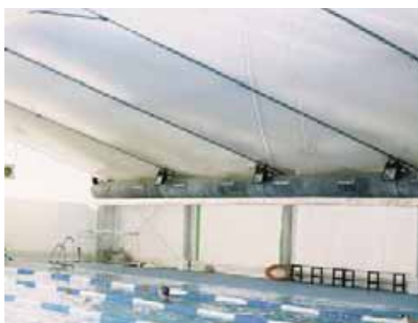
Piscina Can Zam (Barcelona)