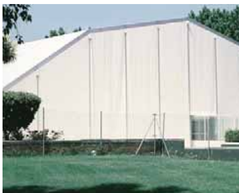
Piscina Municipal de Fuenlabrada (Madrid)

El Sistema es aplicable a piscinas de dimensiones diversas, si bien la mayor parte de instalaciones públicas responden a los dos tipos que señalamos a continuación.