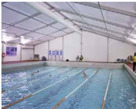
Club de Natació Manresa (Barcelona)