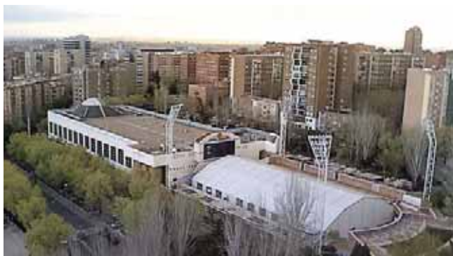
Piscina Mundial 86 (Madrid): Cubierta.