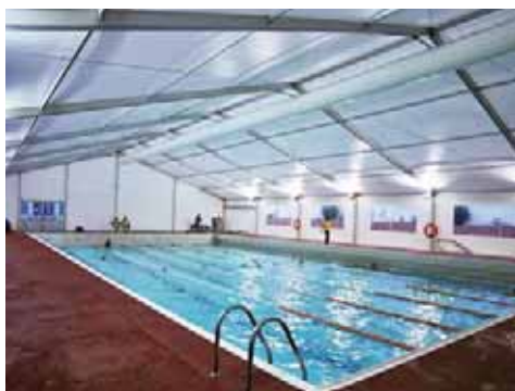
Club de Natació Manresa (Barcelona)

La aportación de agua nueva será del orden del 5% en volumen día.