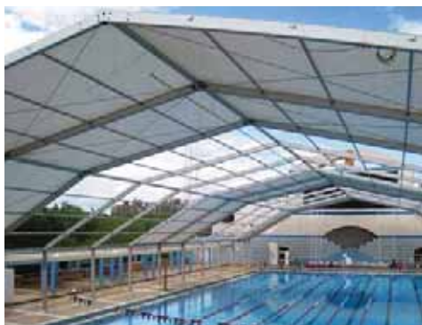
Piscina Mundial 86 (Madrid): Semi-cubierta.