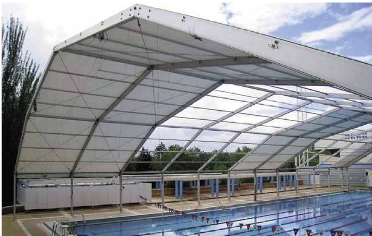
Piscina Mundial 86 (Madrid)