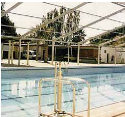
Piscina Municipal de Buñol (Valencia)