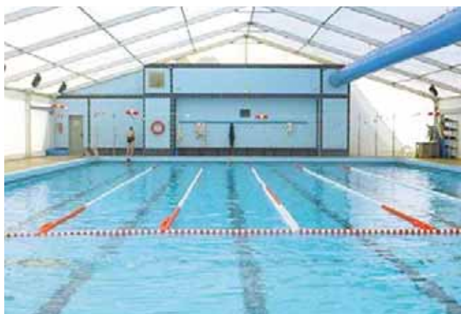
Carpa modelo Big de 20 x 30 metros