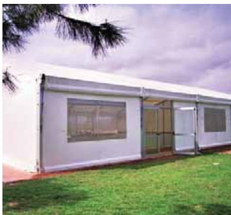
Piscina de Benifairó de Les Valls (Valencia)