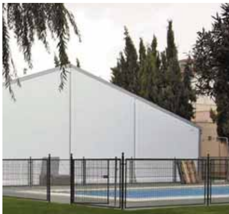
Piscina Municipal de Gálvez (Toledo)