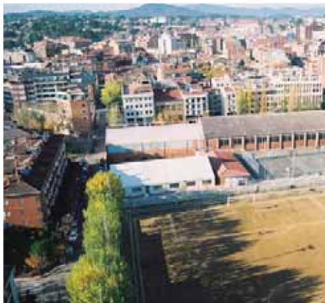
Piscina Municipal de Sant Cugat (Barcelona)