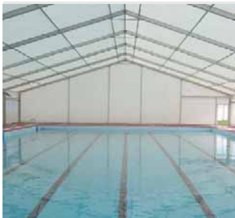
Piscina Municipal de El Tiemblo (Ávila)