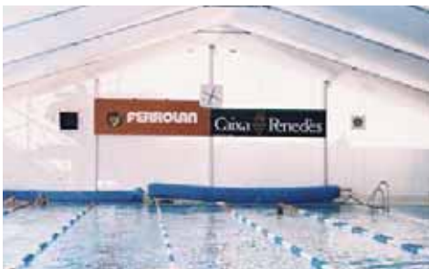
Piscines Municipals Can Zam (Barcelona)