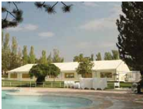
Real Automovil Club de España (Madrid)

Señalamos a continuación algunos de los aspectos en los que nuestro sistema aporta mejoras comparativas: