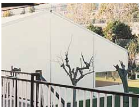
Col.legi Salesià S. Joan Bosco (Barcelona)