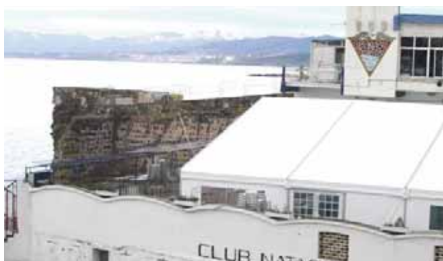
Carpa modelo Big de 18 x 30 metros