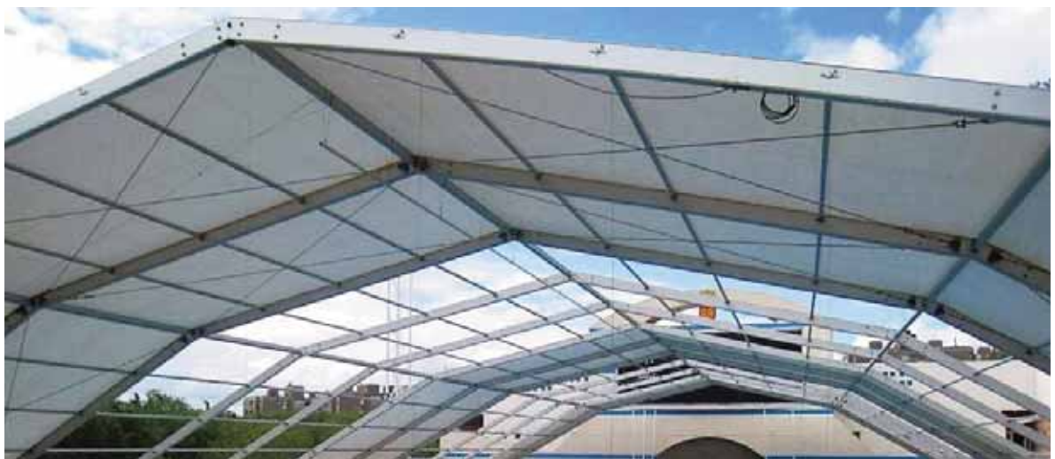
Piscina Mundial 86 (Madrid)

Los nudos, piezas de ensamblaje, cables, tensores y demás complementos, se ajustan al tipo de pórtico y a su resistencia mecánica.