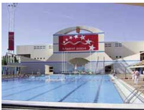
Piscina Mundial 86 (Madrid): Descubierta.