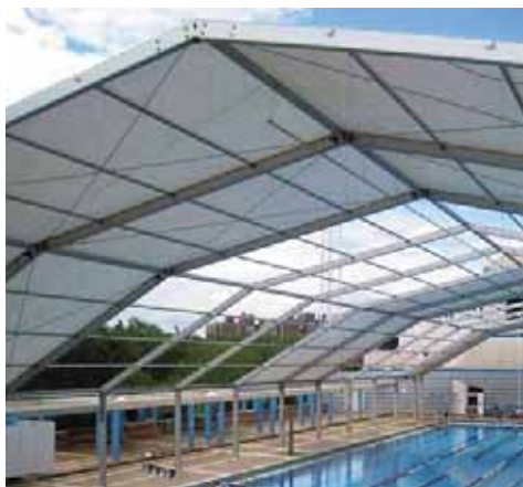
Piscina Mundial 86 (Madrid)