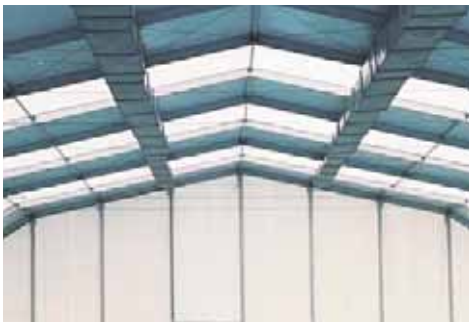
Piscina Municipal de Fuenlabrada (Madrid)

Los accesos de usuarios a la piscina cubierta, salvo las salidas de emergencia, deben conducir a los aseos y duchas. En caso de separación, se requiere de pasillo cerrado con un ancho mínimo del orden de 1,5 a 2 m.