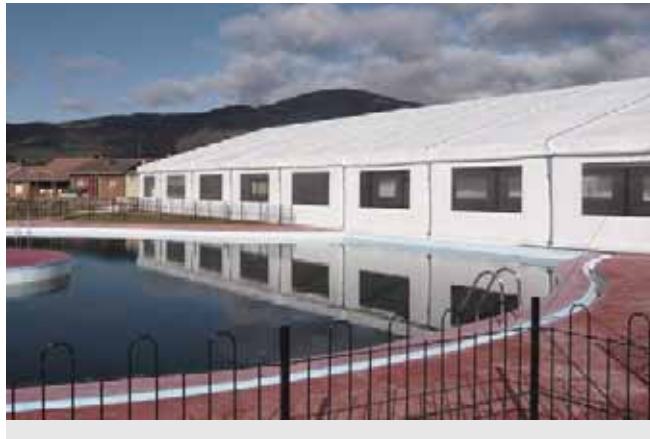
Carpa modelo Big de 20 x 35 metros