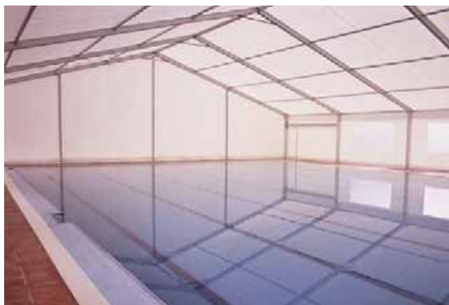
Carpa modelo Big de 20 x 35 metros