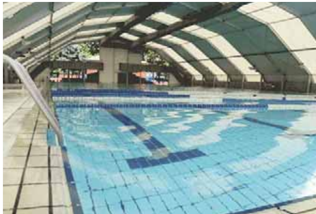
Pabellón modelo Poligonal de 32 x 56 m