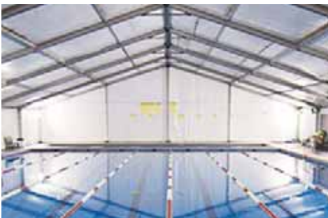
Club Deportivo Los Cedros (Madrid)