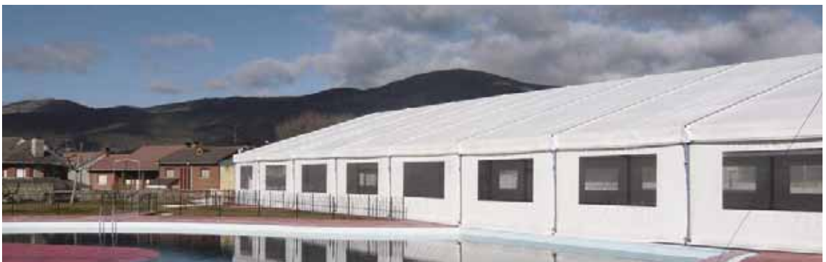
Piscina Municipal de El Tiemblo (Ávila)