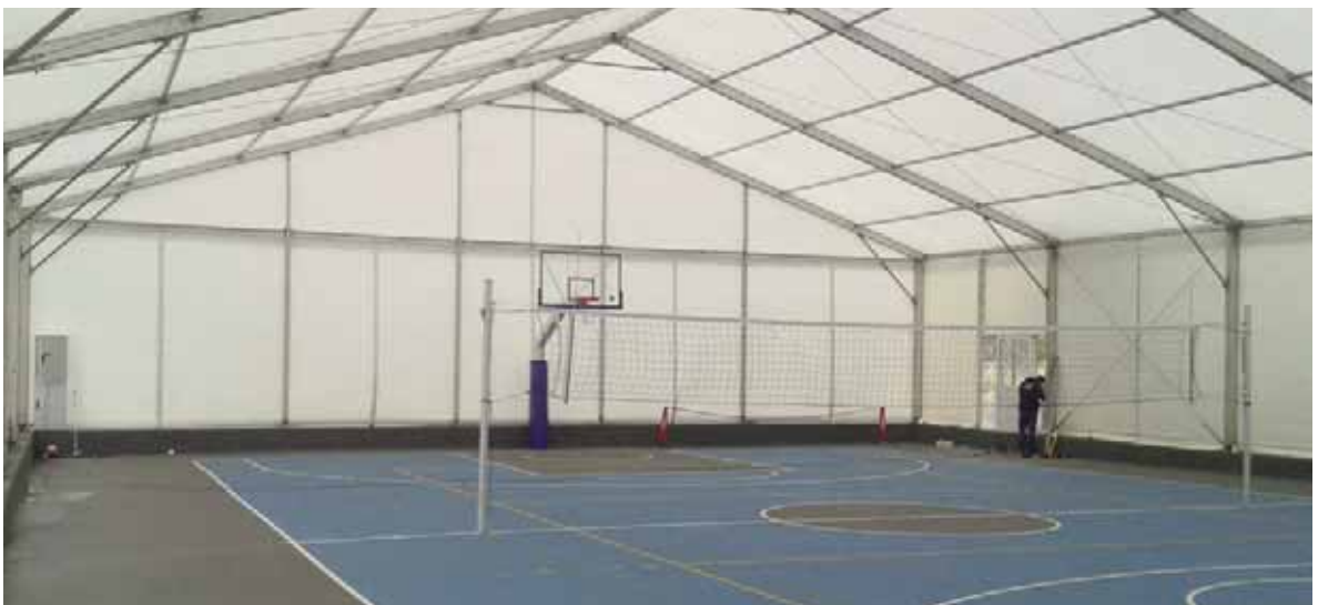
Cubierta para pista polideportiva.