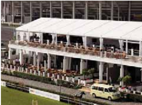
Cerramiento en lona practicable