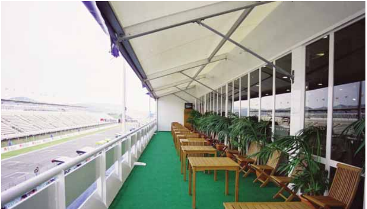
Cubierta del RACC en el Circuit de Velocitat de Montmeló (Barcelona)

El plazo de entrega y montaje, desde el acto de contratación en firme y una vez realizada la definición particular de la cubierta es de entre 45 y 60 días, según disponibilidad del modelo y carga de trabajo.