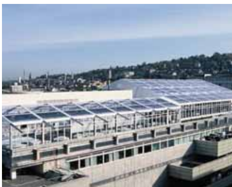
Cubierta de lona transparente