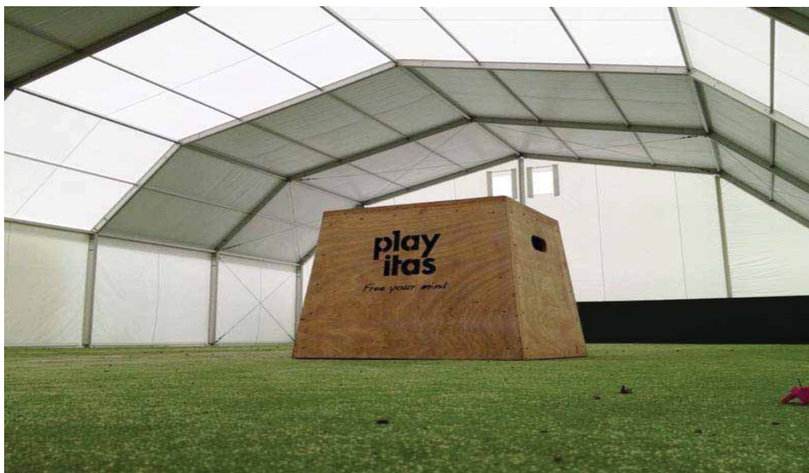
Playitas Resort (Fuerteventura). Cubiertas poligonales para canchas de tenis

Este Sistema responde a la creciente demanda de prácticas deportivas a cubierto, que deben atenderse durante todo el año, y permite mejorar la explotación de pistas al aire libre.