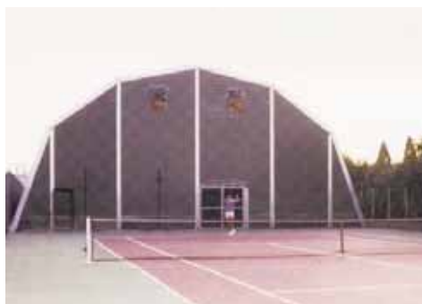
Cubiertas y cerramientos en compuesto textil.

Los nudos, piezas de ensamblaje, cables, tensores y demás complementos, se ajustan al tipo de pórtico y a su resistencia mecánica.