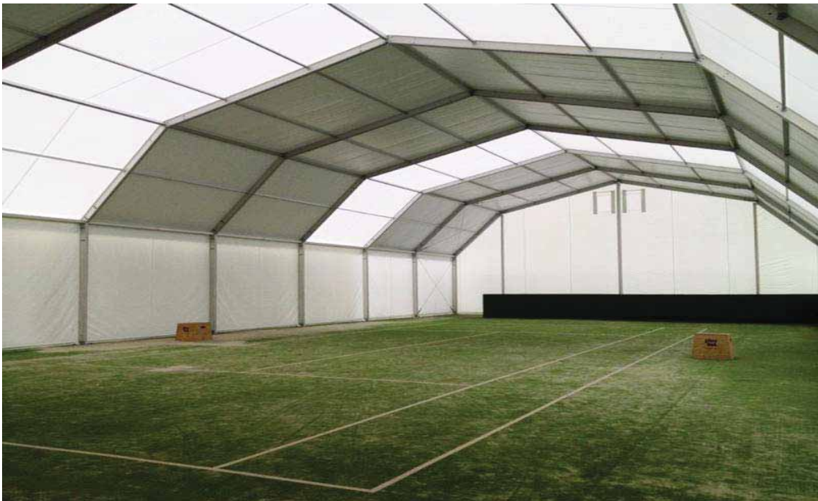
Hotel Playitas Resort. Poligonal de 18 metros de pórtico