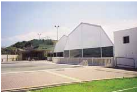
Real Sociedad de Tenis de La Magdalena (Cantabria). Cubiertas para pista de tenis.