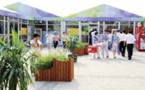
Paneles de carpintería de aluminio y cristal doble