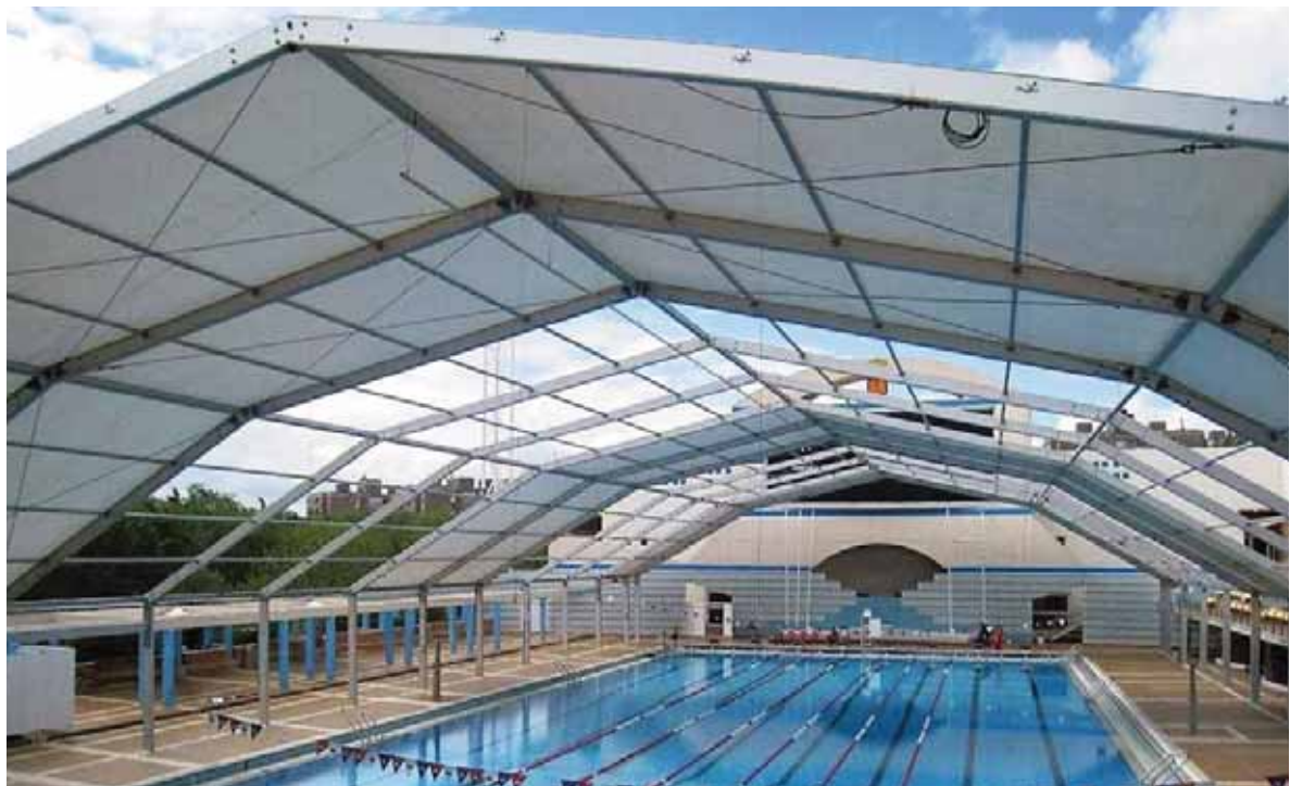
Cubierta modelo Poligonal de 30 metros de pórtico