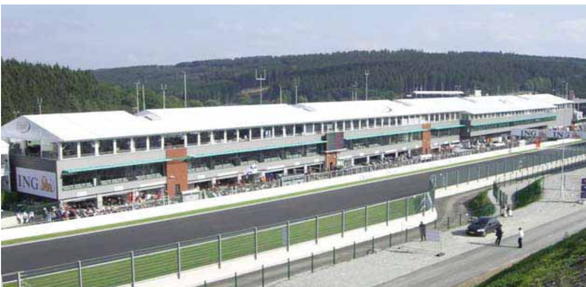
Circuito F1 de Spa-Francorchamps (Bélgica)