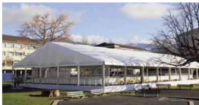
Cubiertas técnicas con alta resistencia a carga de nieve.