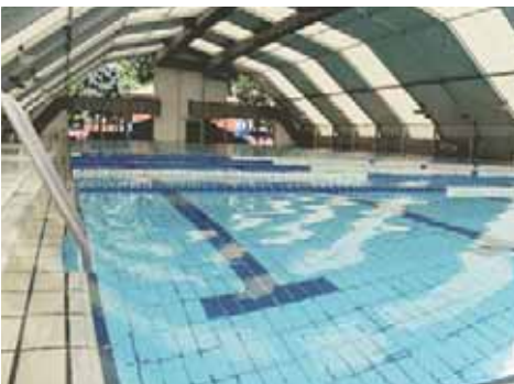
Piscina Municipal de Fuenlabrada (Madrid).