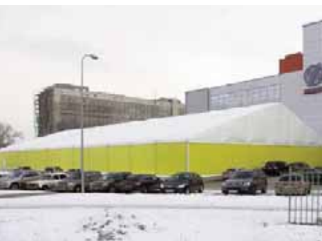
Paneles aislantes de chapa rellenos de espuma de poliuretano