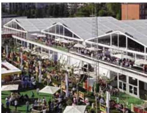
Puertas dobles de acceso

Es un Sistema y, en él, están previstos aquellos complementos que se requieren para completar el pabellón a su función. Desde puertas de acceso para personas, puertas para vehículos, con aperturas antipánico, salidas de emergencia, colores de fondo para contraste de pelota, transparencias, etc.