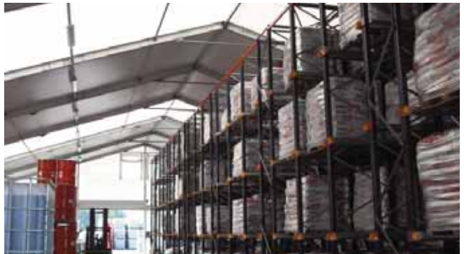
Lasenor Emul (Barcelona)