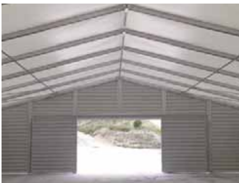
Cales de Pachs (Barcelona)

El precio del arriendo disminuye en la medida en que se incrementa el tiempo mínimo de alquiler contratado.