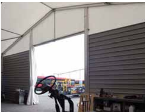
Carrocera Castrosúa (A Coruña)