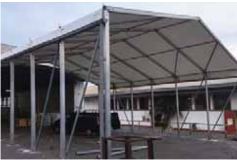
Pallex Iberia (Madrid)