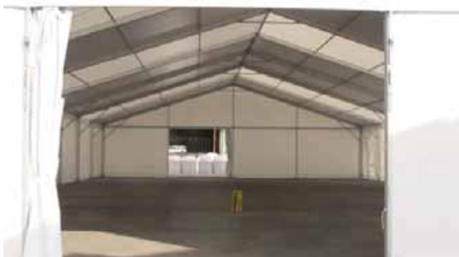
Nave modelo Big de 20 x 40 x 4 m