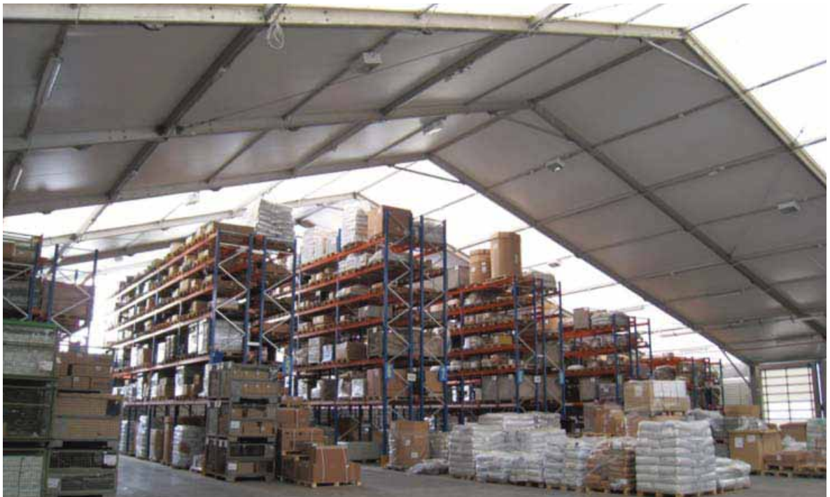
Robert Bosch Gasoline Systems (Madrid)

Este conocimiento y capacidad están a su servicio para ayudarle en su Proyecto.