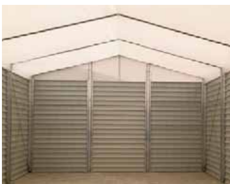
Celler Masroig (Barcelona)