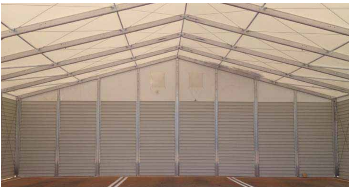
Aceros para la Construcción (Tarragona)

Siempre puede optar por la compra de nuestras naves desmontables. La gama de modelos disponibles en venta es más amplia que la destinada al alquiler.