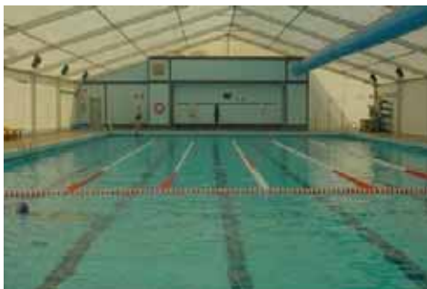
Piscina Municipal de Buñol (Valencia)