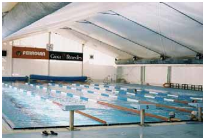
Carpa modelo Big de 18 x 30 metros