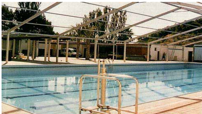
Piscina Municipal de Buñol (Valencia)