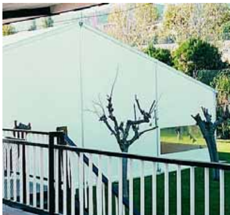
Col·legi Salesià de la Vall d'Hebrón (Barcelona)