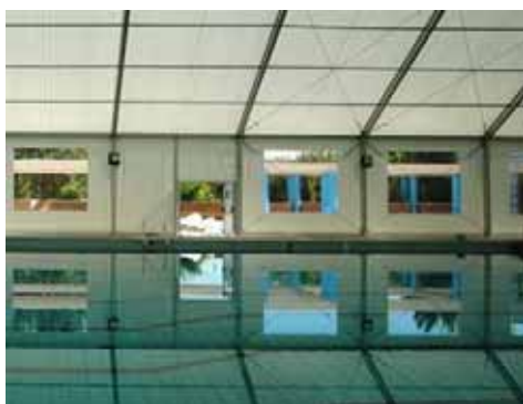
Piscina Municipal de Buñol (Valencia)