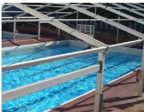
Piscina Municipal de Manresa (Barcelona)