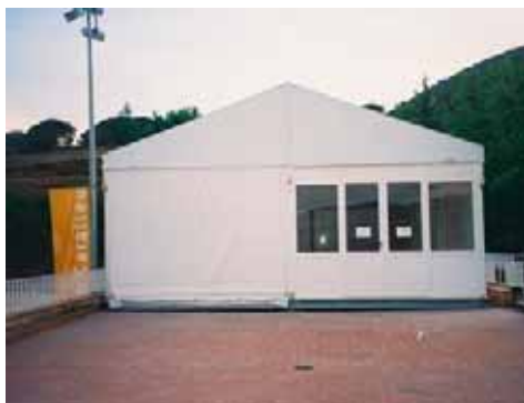
Club Esportiu Municipal Can Caralleu (Barcelona)