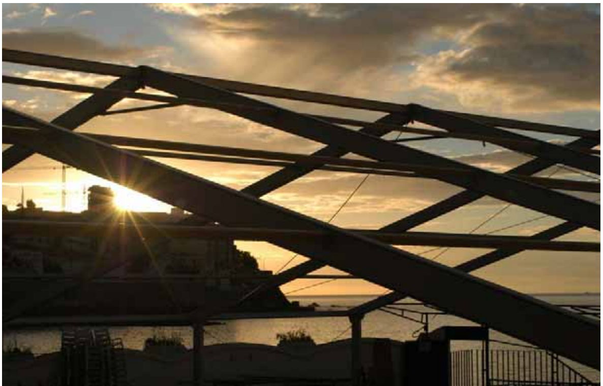
Club de Natación Caballa (Ceuta)

Este conocimiento y capacidad están a su servicio para ayudarle en su Proyecto.