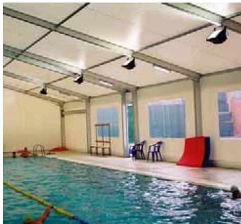
Piscina Municipal de Sant Cugat