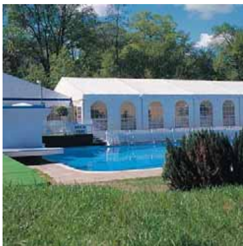
Club Natació Banyoles (Girona)