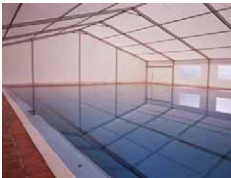
Piscina Municipal de Benifairó (Valencia)