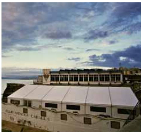
Club de Natación Caballa (Ceuta)