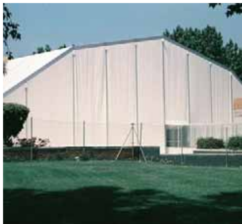
Piscina Municipal de Fuenlabrada. (Madrid)