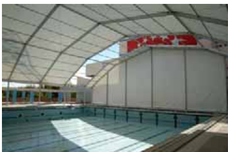
Piscina Mundiales 86 del IMDER (Madrid)