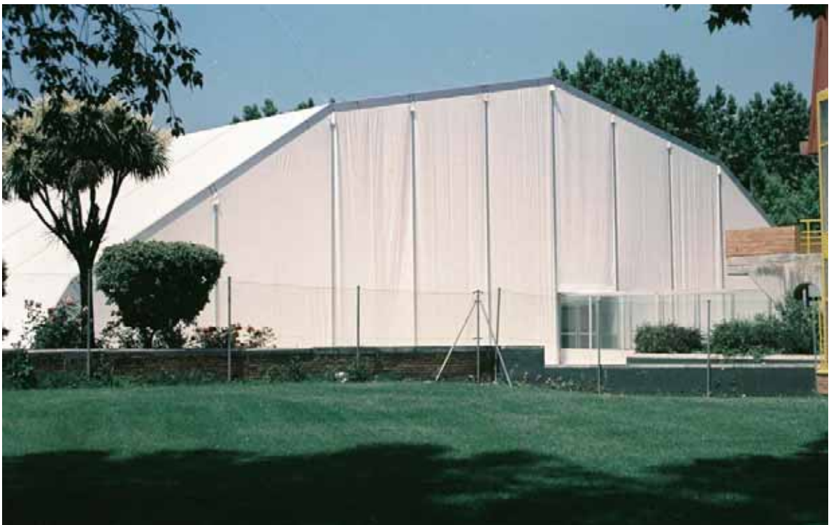
Piscina Municipal de Fuenlabrada (Madrid)