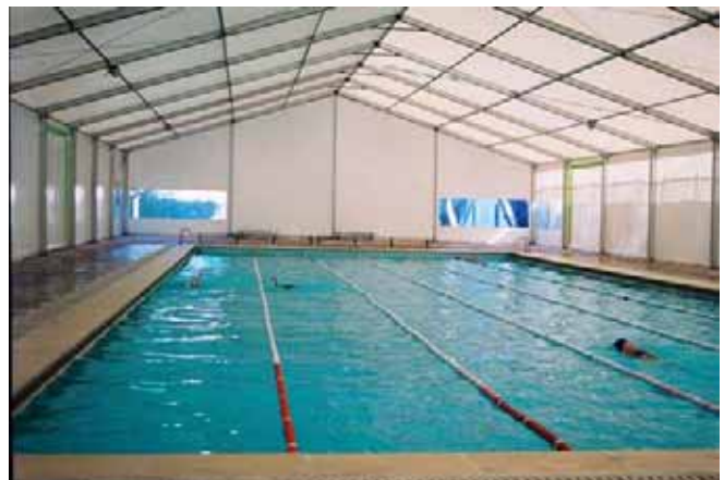
Carpa modelo Big de 20 x 40 metros