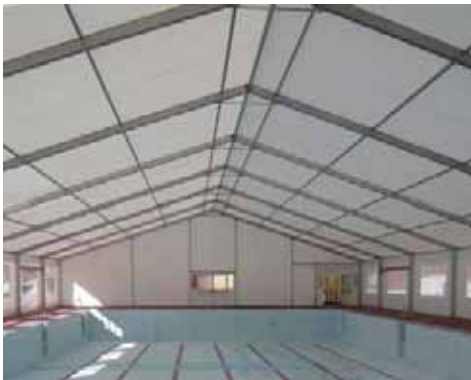
Piscina Municipal de El Tiemblo (Ávila)

El compuesto textil opaco es de color blanco. Para los compuestos traslúcidos, pueden aplicarse, además del blanco, una gama de colores.