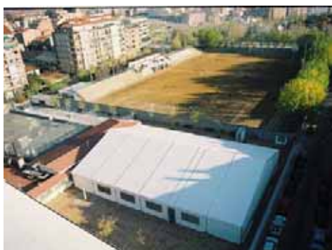
Piscina Municipal de Sant Cugat (Barcelona)