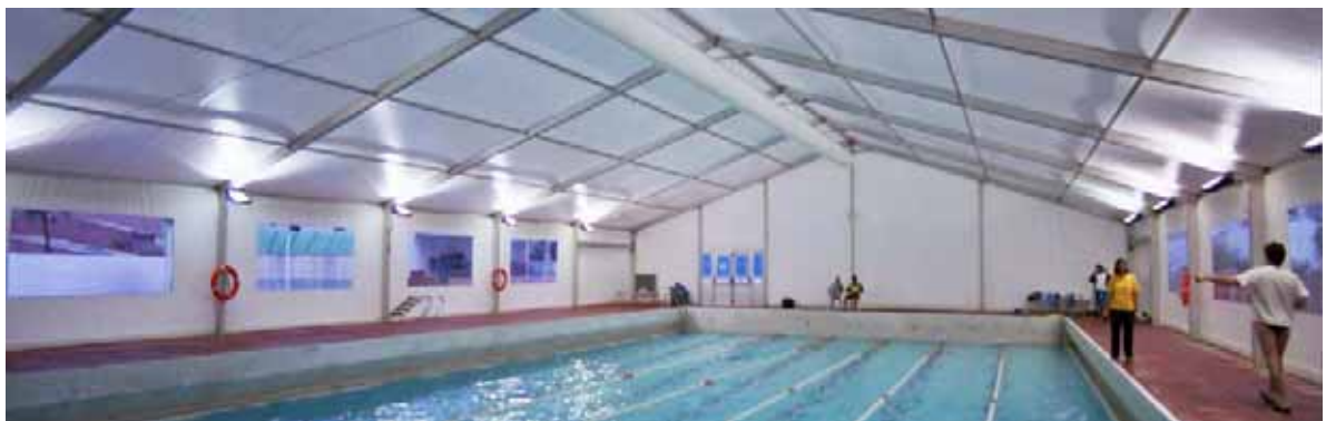
Piscina Municipal de Manresa (Barcelona)