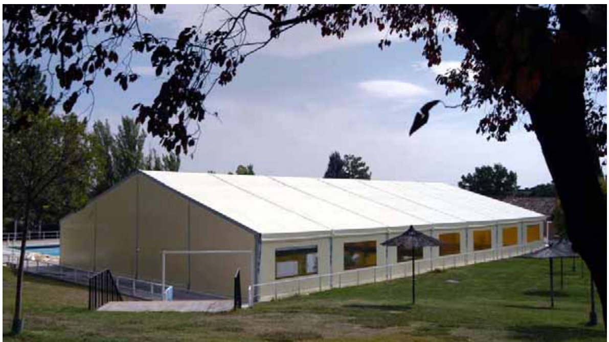
Real Automóvil Club de España (Ciudalcampo)