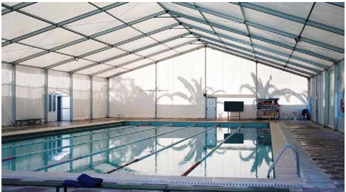
Col·legi Salesià de la Vall d'Hebrón (Barcelona)

El plazo de entrega y montaje, desde el acto de contratación en firme y una vez realizada la definición particular de la cubierta, es de, aproximadamente, 45 días.