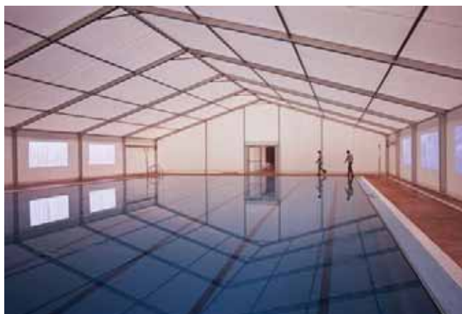
Carpa modelo Big de 20 x 35 metros