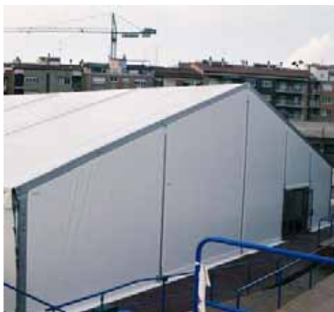
Club Deportivo Los Cedros (Madrid)