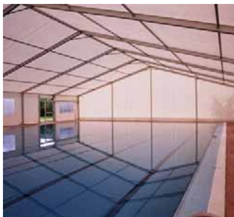
Piscina Municipal de Benifairó de Les Valls