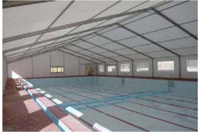
Carpa modelo Big de 20 x 35 metros