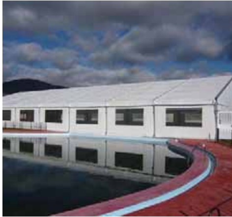
Piscina Municipal de El Tiemblo (Ávila)