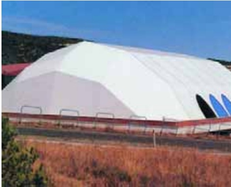
Academia General Básica de Suboficiales (Talarn)