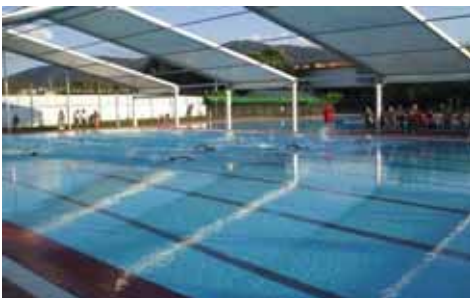
Piscina Municipal de El Tiemblo (Avila)