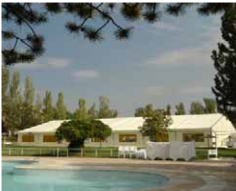
Real Automóvil Club de España (Ciudalcampo)