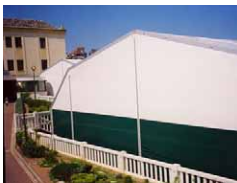
Real Sociedad de Tenis de La Magdalena (Santander)