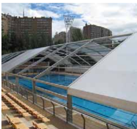
Piscina Mundiales 86 del IMDER (Madrid)