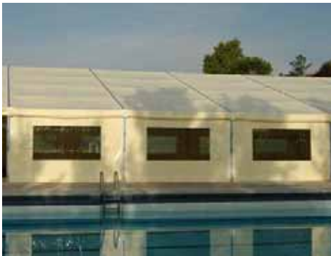
Real Automóvil Club de España (Ciudalcampo)

Señalamos a continuación algunos de los aspectos en los que nuestro sistema aporta mejoras comparativas: