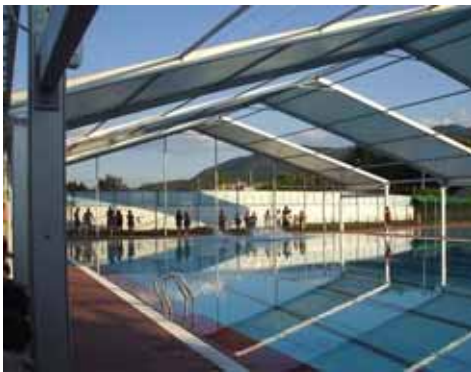
Piscina Municipal de El Tiemblo (Ávila)

En aluminio, acero inoxidable, aluminio fundido, acero fundido y acero galvanizado. Tratamientos anticorrosión por humedad y por la acción del cloro.