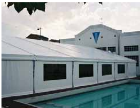
Club Natació Manresa (Barcelona)

Fuente: Peter Neufert, Arte de proyectar en arquitectura Neufert, México, Gustavo Gili, 1995, 14ª ed., P. 466-470