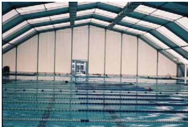
Pabellón modelo Poligonal de 32 x 56 m