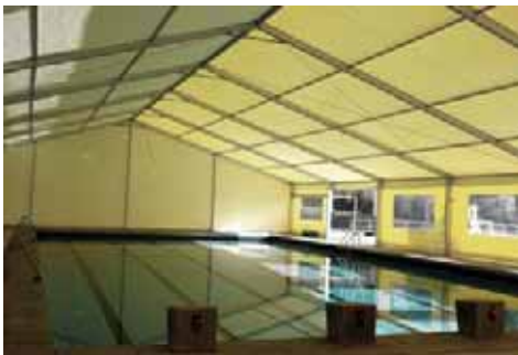
Real Automóvil Club de España (Ciudadcampo)

Los accesos de usuarios a la piscina cubierta, salvo las salidas de emergencia, deben conducir a los aseos y duchas. En caso de separación, se requiere de pasillo cerrado con un ancho mínimo del orden de 1,5 a 2 m.