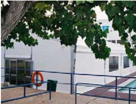
Piscina Municipal de Manresa (Barcelona)