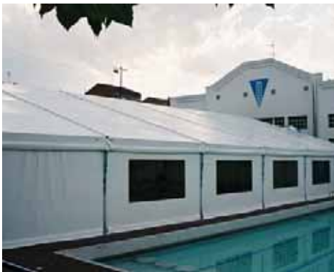
Piscina Municipal de Manresa