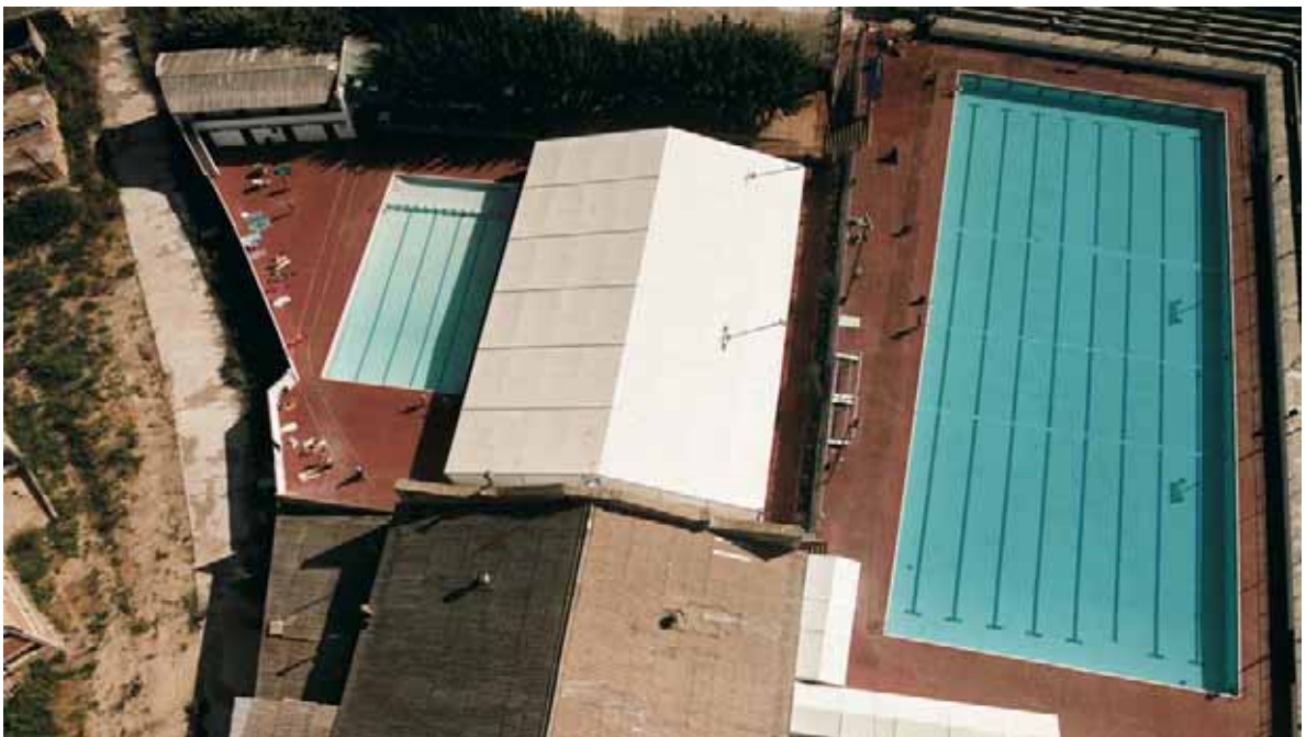
Club de Natació Manresa (Barcelona)

Nuestra Oficina Técnica está a su disposición para facilitarle aquella información adicional que se requiera para completar el proyecto y su realización