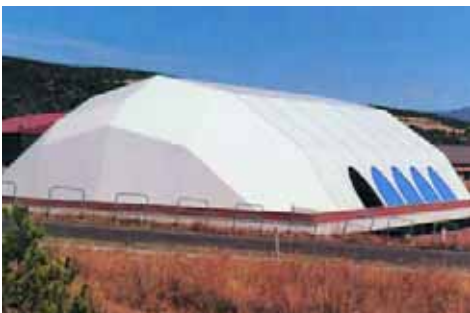
Academia Gral. Básica de Suboficiales de Talarn (Lleida)