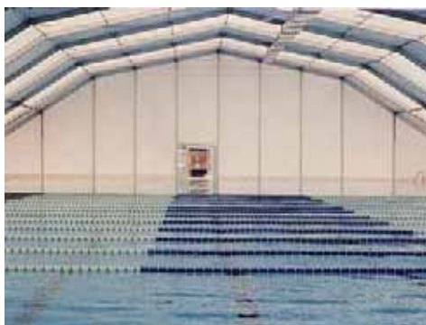
Piscina Municipal Fuenlabrada (Madrid)

La aportación de agua nueva será del orden del 5% en volumen día.