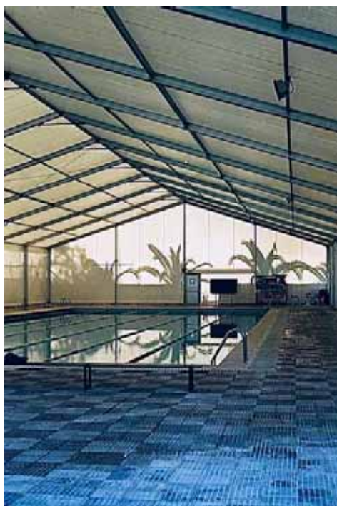
Col·legi Salesià de la Vall d'Hebrón (Barcelona)

Como complemento específico para piscinas, cabe destacar el pasillo de unión entre la cubierta de piscina y vestuarios. Este se realiza, con una forma y longitud en función del emplazamiento y distancia a cubrir, y con un ancho de 1,5/2 m.