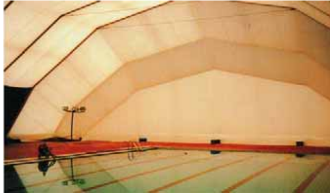
Pabellón modelo Poligonal de 28 x 35 m