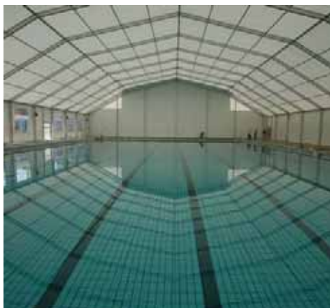
Piscina Mundiales 86 del IMDER (Madrid)