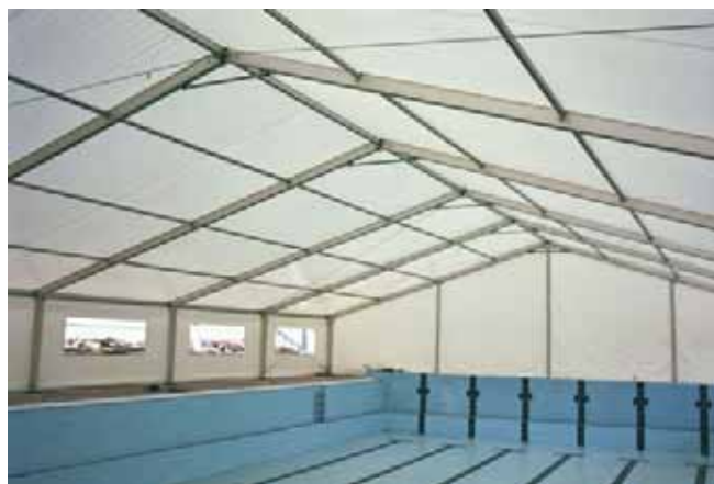
Carpa modelo Big de 18 x 30 metros