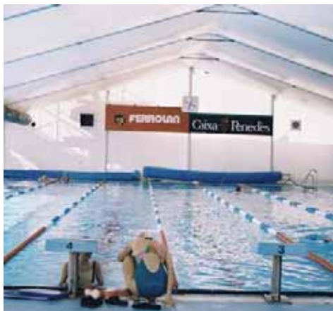
Piscines Municipals Can Zam (Santa Coloma de Gramanet)