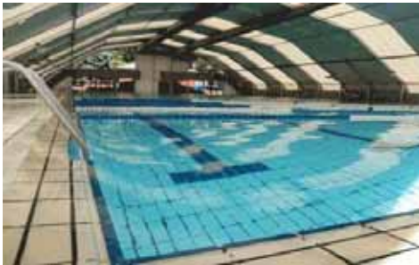
Piscina Municipal de Fuenlabrada (Madrid)

Existen buenos equipos de diversos fabricantes que dependen, en cualquier caso, del eficaz mantenimiento posterior. Nuestra Oficina Técnica está a su disposición para ampliarle cuantos datos e información pueda requerir para completar el Proyecto concreto con su instalador.